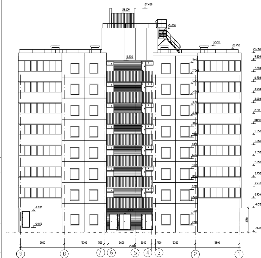
Фасад в осях 9-1 М 1:100